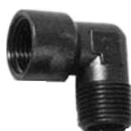
COUDE 90° MÂLE-FEMELLE